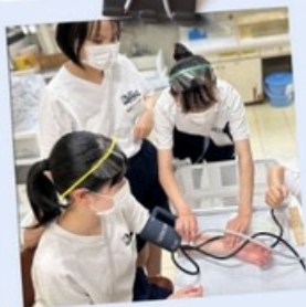
血圧を測ってみよう!