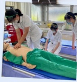
心肺蘇生法を習いました